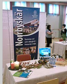
KFUM Umeås monter i Vilhelmina

Detta brev sänds till alla medlemmar och samarbetspartners. Om du inte vill ha fler nyhetsbrev eller har råkat få flera exemplar, meddelar du bara detta till nyhetsbrev@kfum.nu . Samma adress används för synpunkter och om du har något att berätta som kan publiceras i nästa brev.