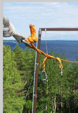
En av årets nyheter: