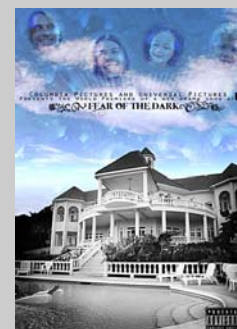
Affischutställning på Galleri Vågen